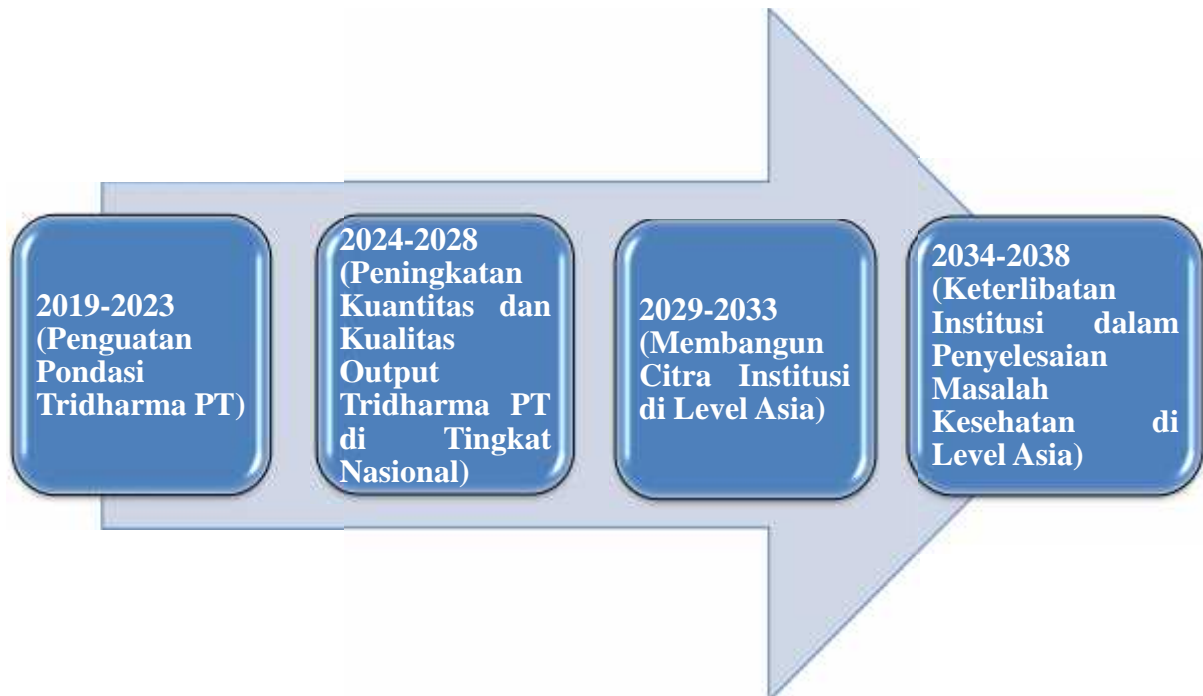
Milestone Pengembangan FIKES UNRIYO 2019 - 2038